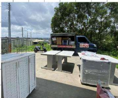
建置醫療站、人員招募、物資徵求